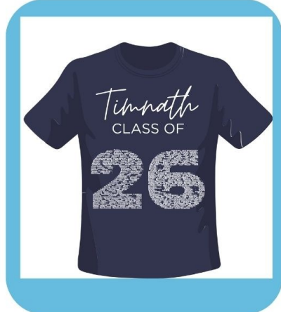
SENIOR T-SHIRT *ALL GRADUATE NAMES INCLUDED*