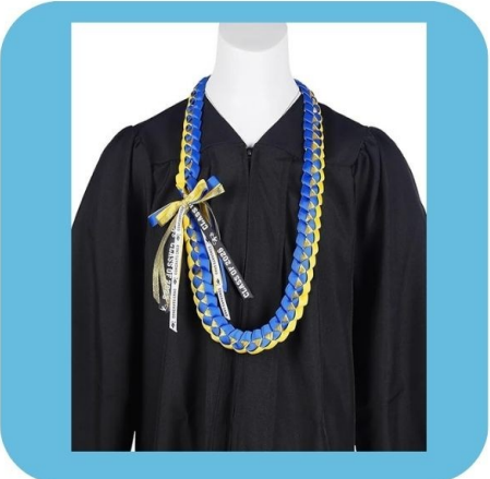
GRADUATE RIBBON LEI

FOLLOW THE LINK TO SEE MORE DETAILS ON THESE PRODUCTS AND MORE!! ORDER BY APRIL 10TH!