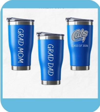
PARENT OF GRAD TUMBLER