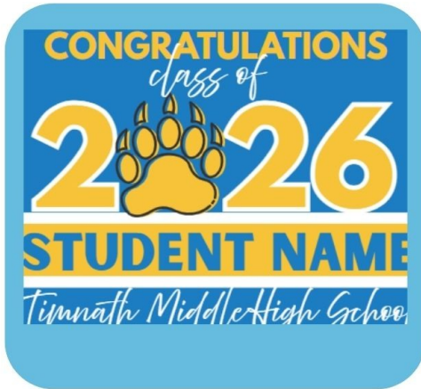
PERSONALIZED GRADUATE YARD SIGNS

FOLLOW THE LINK TO SEE MORE DETAILS ON THESE PRODUCTS AND MORE!! ORDER BY APRIL 10TH!